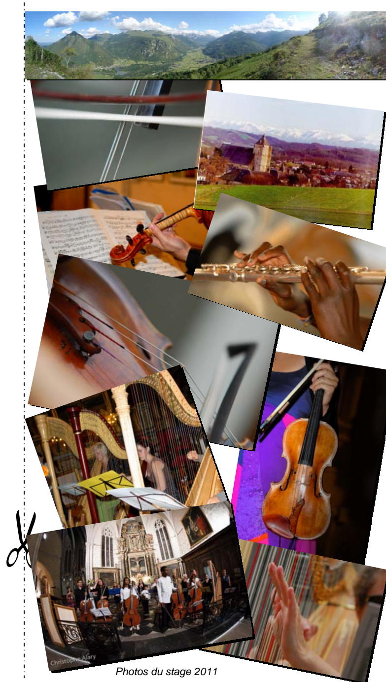
Photos du stage 2011